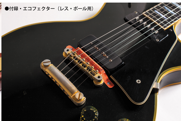
●付録・エコフェクター（レス・ポール用）