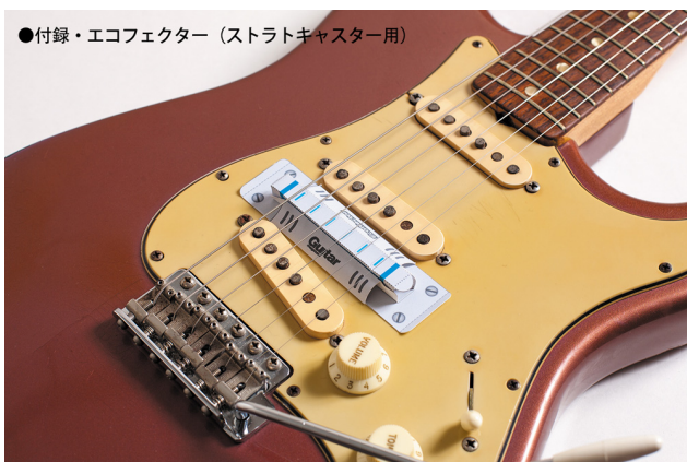
●付録・エコフェクター（ストラトキャスター用）

ヨッチャン考案による電気を使わない“エコフェクター”。ギターに付けると、あっと驚く“エフェクト”がかかります。ペーパークラフトで作ってみよう。