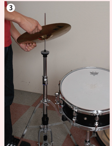
3 下になるシンバル（ボトム）は内側が上を向くようにセット。