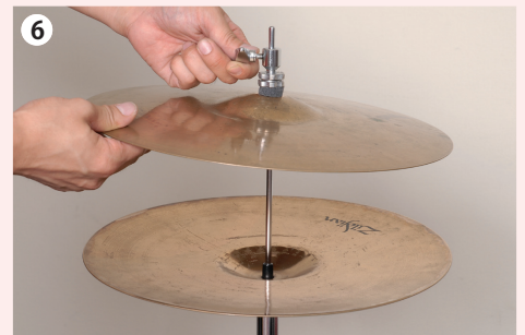
6 上側のシンバルをスタンドに取り付ける。