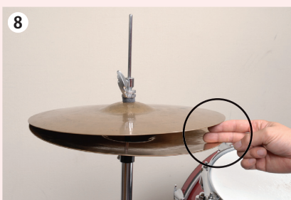
8 上下のシンバルの間隔は、指2本ぐらいを参考にしよう。