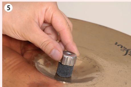
5 内側にも同様にフェルトとクラッチをセット。