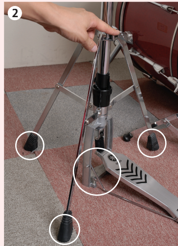
2 3つの脚と、中心部がしっかり床に付くように開き具合を調整しよう。