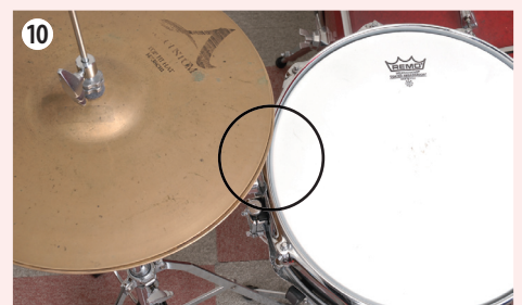
10 スネア・スタンドの位置は、スネアの左端とハイハットの右端がギリギリ重なるくらいが目安。