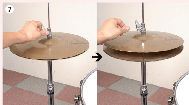
7 ペダルを軽く踏み込み、クラッチをしっかり締め込んで固定。