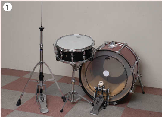
1 ハイハット・スタンドをスネアの左に配置。