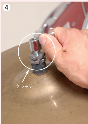
4 上になるシンバルの外側にフェルトとクラッチをセット。