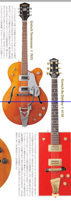
Gretsch Tennnessan # 7655

1980年代前半から後半にかけて、日本のロックシーンで最も人気を博したエレクトリックギターの一つ。その特徴は、ボディの薄さ、軽量さ、そして美しい音質にある。このモデルは、1980年代前半に発売されたもので、当時の若手ミュージシャンに広く愛用された。