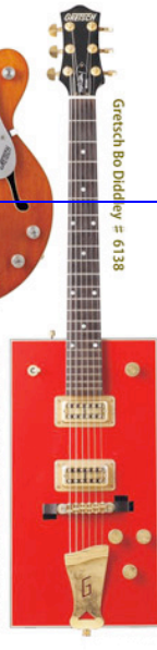
Gretsch Bo Diddley # 6138

1980年代前半から後半にかけて、日本のロックシーンで最も人気を博したエレクトリックギターの一つ。その特徴は、ボディの薄さ、軽量さ、そして美しい音質にある。このモデルは、1980年代前半に発売されたもので、当時の若手ミュージシャンに広く愛用された。