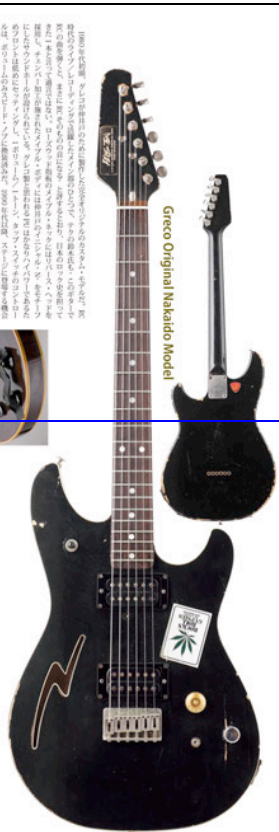
Greco Original Nakaido Model

オリジナルから20周年記念として、ボディカラーをブラックに塗り替えたモデルも存在する。また、ピックアップもオリジナルとは異なるモデルが用意されている。